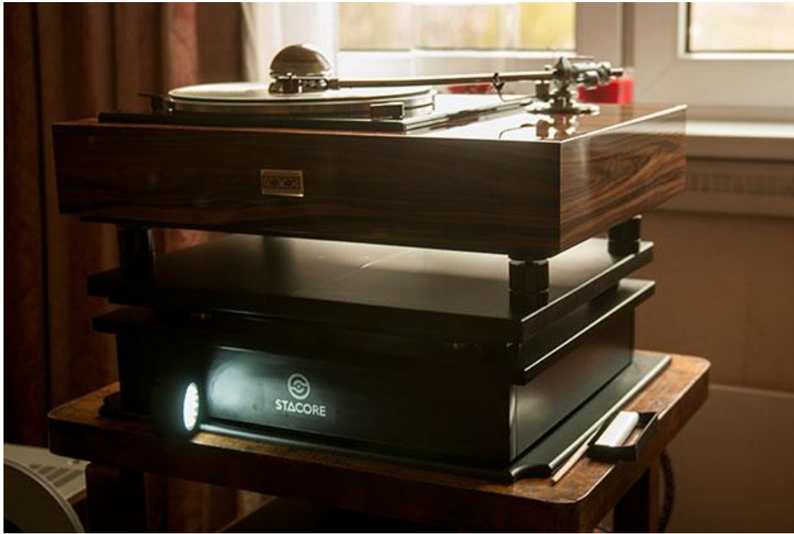
Audio Video Show 2015 - platforma STACORE w pokoju warszawskiego sklepu NOMOS

O założeniach konstrukcyjnych i wpływie platformy na dźwięk różnych urządzeń toru audio opowiemy w teście, który ukaże się na naszym portalu pod koniec listopada. Twórcy platformy i firmy STACORE: Jarek Korbicz i Bogdan Stasiak planują pod koniec roku rozpocząć produkcję pierwszych egzemplarzy. Po fazie testów i prób, a także kilku modyfikacjach, platforma osiągnęła kształt ostateczny. Wykorzystując łożysko kulkowe z węgliku wolframu, dodano do niej kolejny stopień odsprężnienia, dzięki czemu zwiększyła się ilość kombinacji stopni tłumienia zastosowanych w platformie. Obecnie oferuje ona 4 kombinacje, które stosować można w zależności od potrzeb i preferencji.